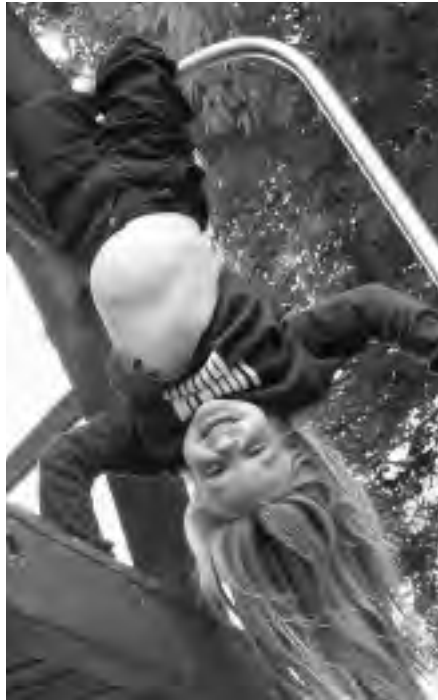
Uchod: Hawlfraint y Llun – Cyngor Stirling Isod: Hawlfraint y Llun – Nicola Butler