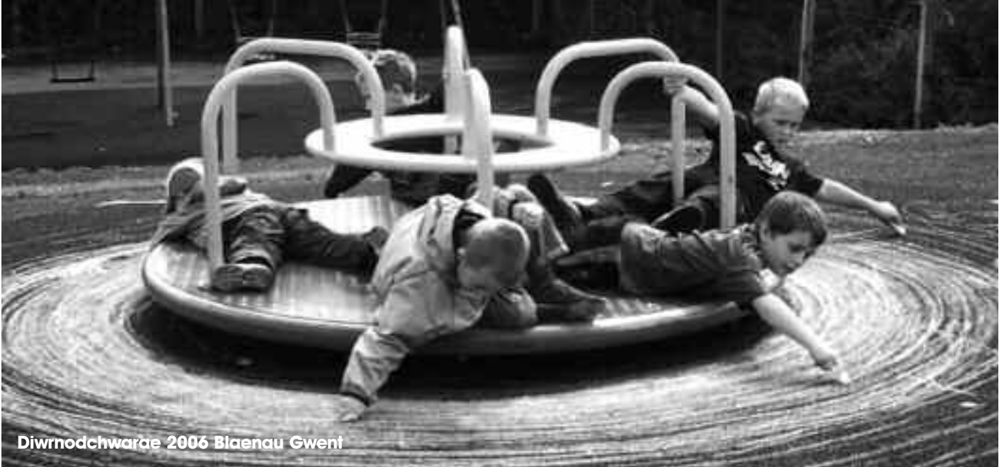
Diwrnodchwarae 2006 Blaenau Gwent