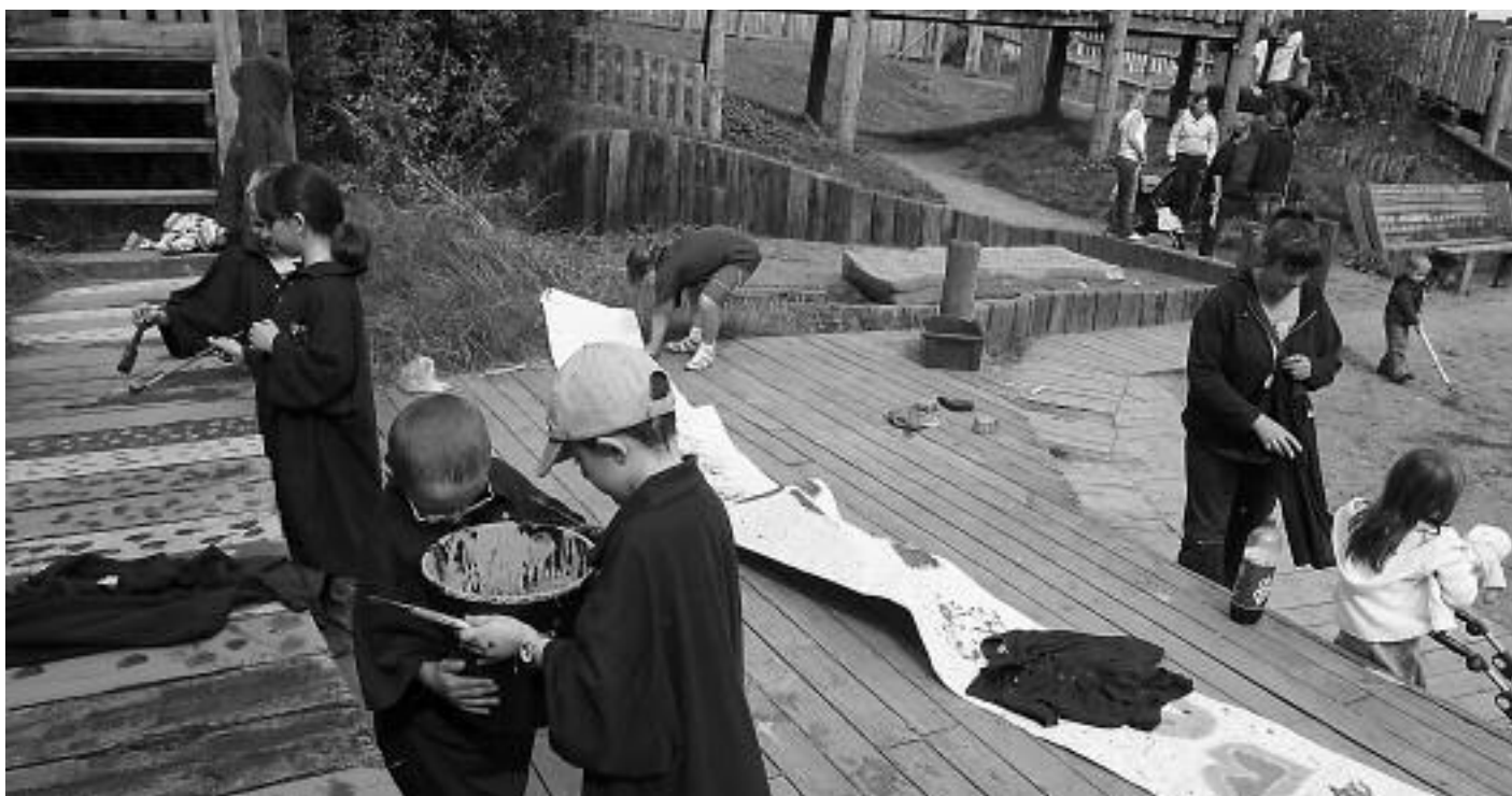
Tynnwyd yr holl ffotograffau o blant yn chwarae yn y rhifyn hwn yn ystod y cyfnod ffilmio.