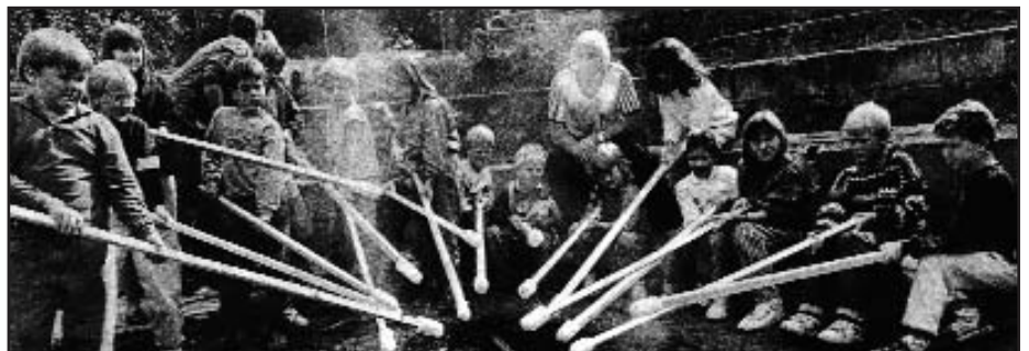
Coginio ffyn bara dros y tân

dymunant. Mae rhai ohonynt yn dewis peidio bwyta'r cawl cyw!