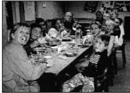
Mae pawb yn bwyta gyda'i gilydd