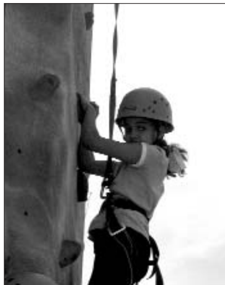
Dringo mewn Diwrnod Profi Chwarae yn y Sblot