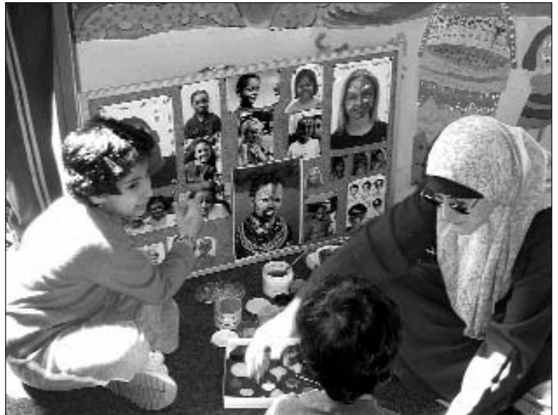
Paentio wyneb mewn Cynllun Chwarae yng Nghaerdydd

Mae ymwybyddiaeth o fodolaeth eich darpariaeth hefyd yn ffactor bwysig wrth ddenu diddordeb gan gymuned, a dyma lle daw cyhoeddusrwydd a hyrwyddo effeithlon i mewn. Mae Gwasanaethau Chwarae Caerdydd wedi cynhyrchu gwbyodaeth amlieithog yn hyrwyddo nid yn unig ddarpariaeth bwrsol ond hefyd gynlluniau chwarae gwyliau. Mae dulliau eraill o hyrwyddo