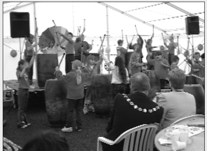
DE: Plant o Ysgol Gynradd Rhos y Fedwen yn mwynhau gweithdy seindorf hen bethau ym mharti lansio Re-Play Glyn Ebwy.