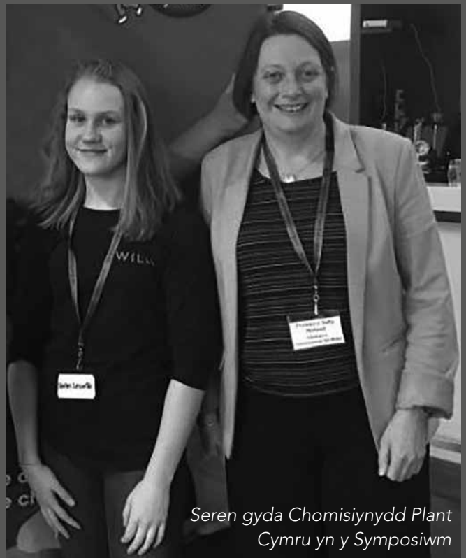
Seren gyda Chomisiynydd Plant Cymru yn y Symposiwm

Enghraifft arall allai fod i gael grwpiau gwirfoddol i gynnal diwrnod o chwaraeon mewn cymunedau, ond nid dim ond y chwaraeon arferol fel rygbi, pêl-droed a pêl-rwyd oherwydd byddai hynny ond yn denu math penodol o gynulleidfa. Gallai'r chwaraeon fyddai'n denu cynulleidfa ehangach, gan nad ydyn nhw ar gael fel arfer, gynnwys osgoi'r bêl ( dodgeball ), pêl fas, cyrsiau mwd, polo dŵr,