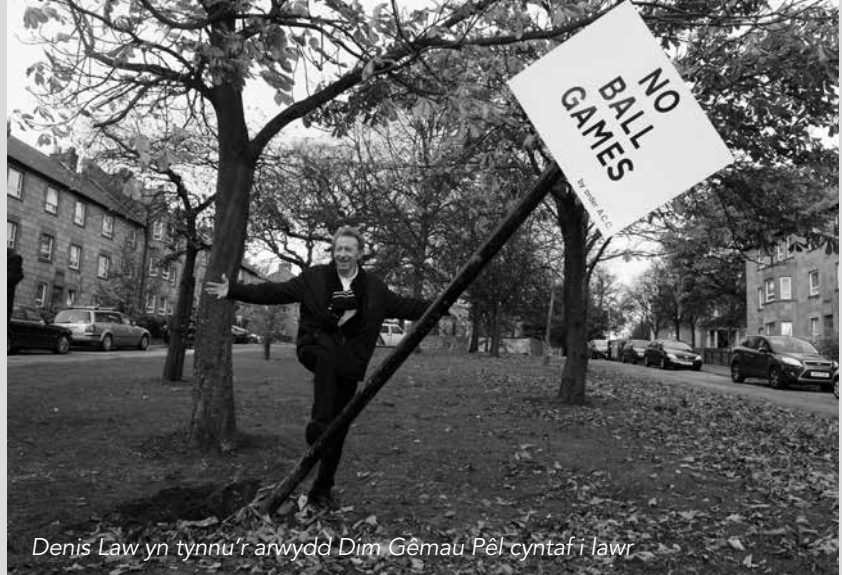
Denis Law yn tynnu'r arwydd Dim Gêmau Pêl cyntaf i lawr

Cafodd cyn saethwr Manchester United a Manchester City gymorth gan un o'i gyd-chwaraewyr blaenorol, Mike Summerbee, i gyflawni'r gwaith pwysig o dynnu'r arwydd cyntaf i lawr.