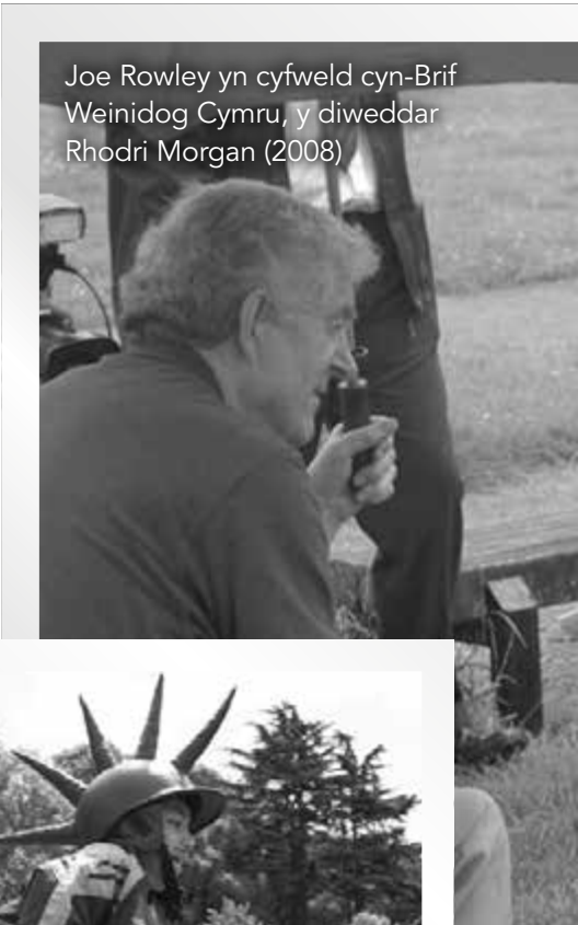
Joe Rowley yn cyfweled cyn-Brif Weinidog Cymru, y diweddar Rhodri Morgan (2008)

Beth alla' i ei ddweud am Chwarae Cymru a'i orchestion? Mae'n fudiad sydd wedi hyrwyddo chwarae, hawliau plant, a datblygiad gweithwyr chwarae am 20 mlynedd.