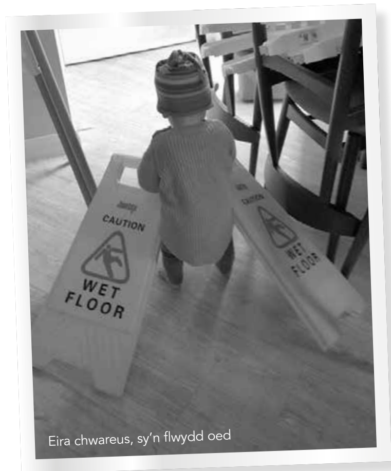
Eira chwareus, sy’n flwydd oed

Cymraeg yw iaith yr aelwyd. Ond, rydw i wedi sylwi y bydd Efan yn chwarae yn Saesneg weithiau. Wrth gwrs, mae wedi cyfathrebu yn Saesneg o’r blaen – boed gyda pherthynas, ffrindiau yn yr ysgol neu weithiwr mewn siop. Ond ar yr adegau hyn mae’n ddihyder ac mae ei eirfa’n wan a’i frawddegau’n dameidiog. Ond pan mae’n chwarae, mae’n siarad yn rhwydd ac mae ei frawddegau’n gywir ac yn gwneud synnwyr.