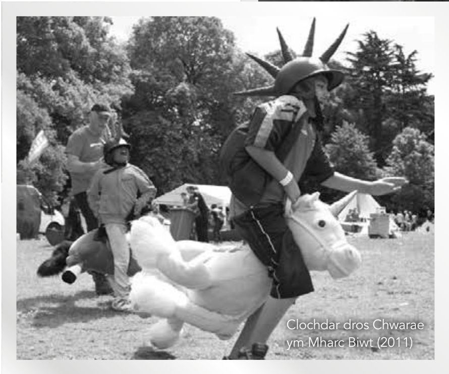
Clochdar dros Chwarae ym Mharc Biwt (2011)

Yn fuan, symudodd Chwarae Cymru i leoliad mwy o faint ym Mae Caerdydd, oedd ar y pryd wedi ei fabwysiadu'n gartref i ddatganoli Cymreig. Yn sgîl datganoli daeth cyfleoedd cyffrous ac fe wnaethom helpu i ddrafftio polisi chwarae cynta'r byd, strategaethau ac yn y pen draw, weithio i ddylanwadu