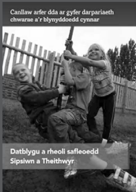
Canllaw arfer dda ar gyfer darpariaeth chwarae a'r blynyddoedd cynnar