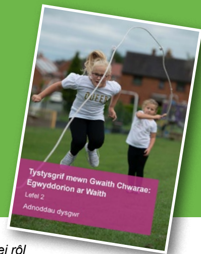
Tystysgrif mewn Gwaith Chwarae: Egwyddorion ar Waith Lefel 2 Adnoddau dysgwr

Mae Llywodraeth Cymru'n diffinio'r gweithlu chwarae fel 'unrhyw un cyflogedig y mae ei rôl yn effeithio ar blant yn chwarae – y bobl hynny allai un ai hwyluso eu chwarae'n uniongyrchol, dylunio ar gyfer chwarae, neu'r rheini sydd a'r pŵer i roi caniatâd i blant chwarae, neu beidio' (Cymru, gwlad lle mae cyfle i chwarae, 2014).